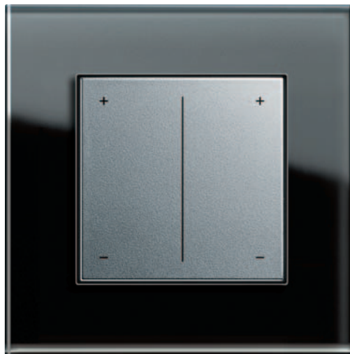
Gira seriedimmer, kleur aluminium Gira Esprit, glas zwart