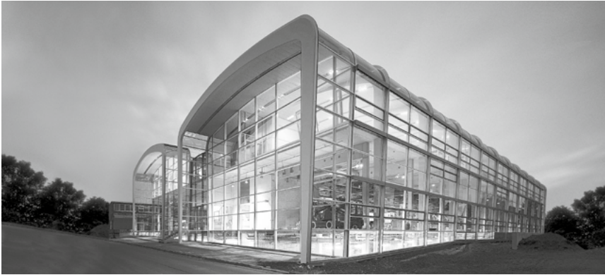
Nave de producción de Gira en Radevormwald