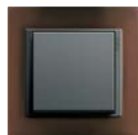
Opak Dunkel- braun