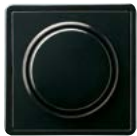
A Schwarz (ähnl. RAL 9005)