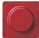
A Rot (ähnl. RAL 3003)