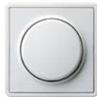
A Reinweiß (ähnl. RAL 9010)