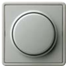
A Grau (ähnl. RAL 7038)